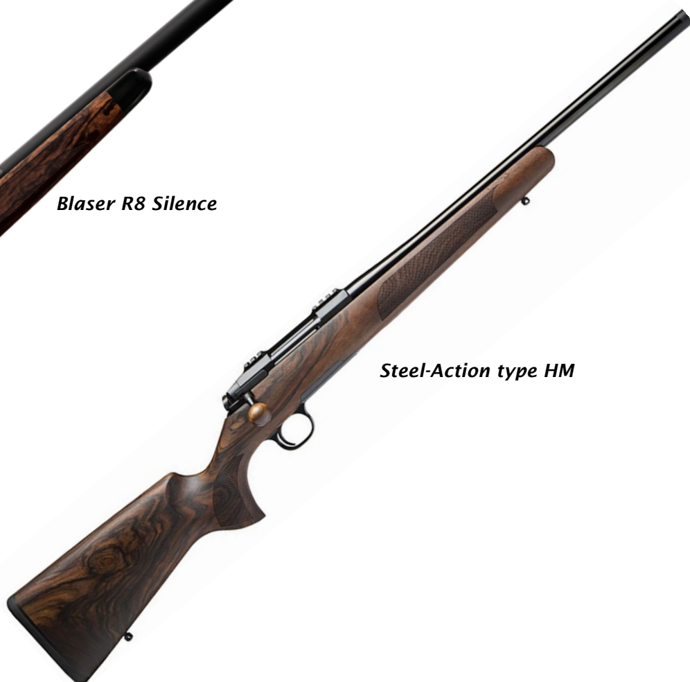
Steel-Action type HM