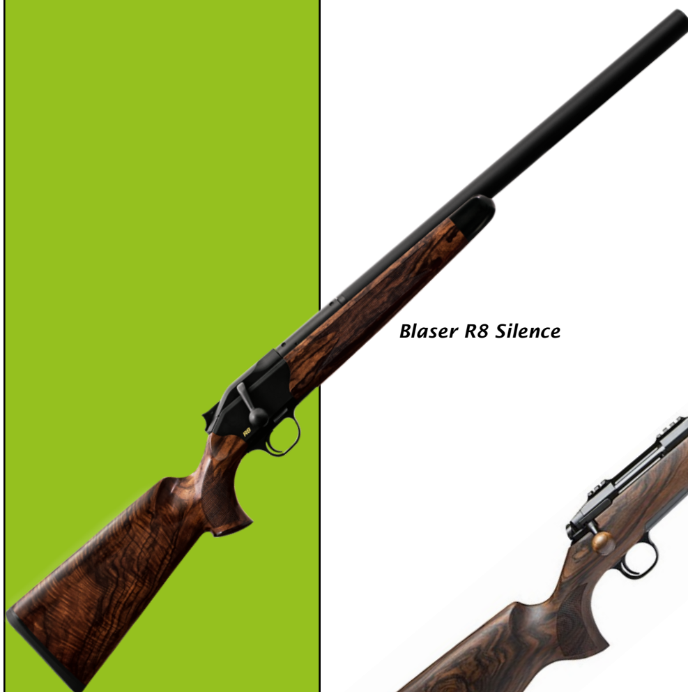
Blaser R8 Silence