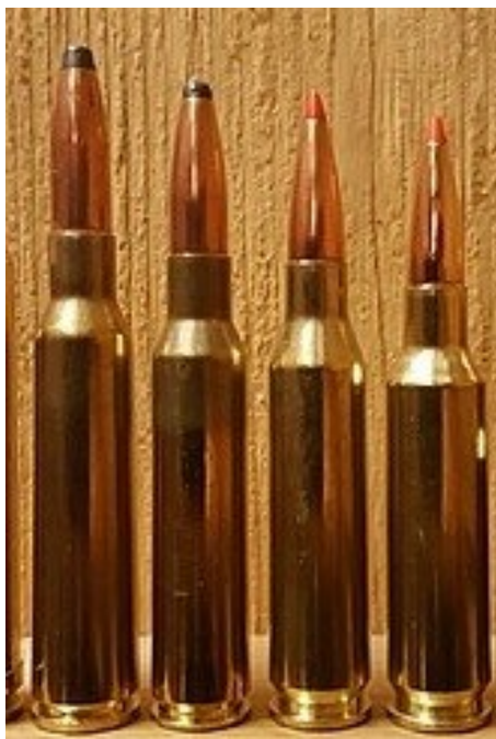
Geheel links 6.5x55SE, geheel rechts 6.5 Creedmoor

De jachtbeurs in Dortmund is voor de meeste jagers indrukwekkend. Één dag is feitelijk onvoldoende om alles te zien, dus het is keuzes maken. Dit jaar via Emmerich met "der Bahn" afgereisd naar de jachtbeurs wat goed is bevallen. In de kiosk van het treinstation een Oostenrijks jachttijdschrift gekocht voor wat leesvoer onderweg en bijspijkeren van de Duitse taal. In het blad een interessant artikel "Antiek treft modern" waarbij het "antieke" kaliber 6.5x55SE wordt vergeleken met de 6.5 Creedmoor.